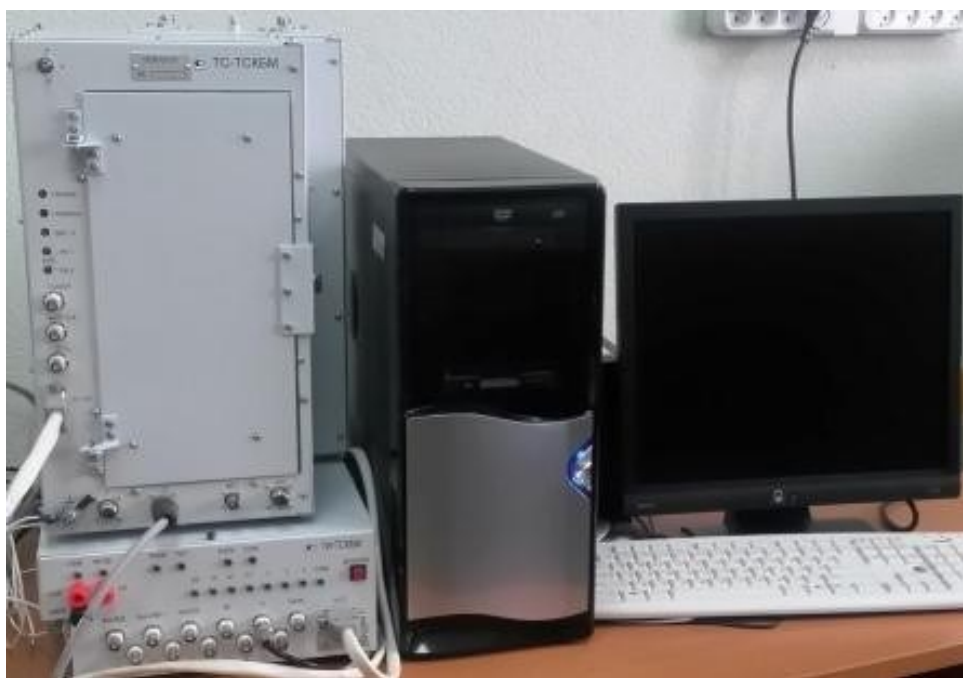
Рисунок 1 – Система для поверки ТСКБМ.